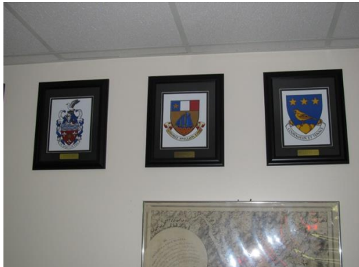
Quelques-une des photo des armoiries Celle des Richard au centre.