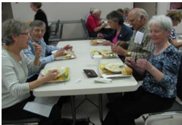
Du fricot acadien, c'est toujours bon!

Enfin, la rencontre se terminera par un souper au fricot, dessert et breuvage au coût de $7. Venez en grand nombre rencontrer vos parents et amis et encourager votre Association.