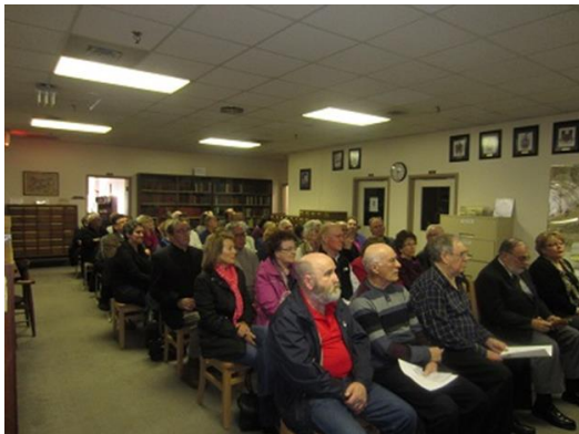
Plusieurs membres de la Fafa ont assisté au dévoilement

Le 11 avril dernier, une cérémonie a eu lieu au Centre d'Études Acadiennes où 4 familles (les Hébert, Lejeune, Maillet et Thibodeau) ont dévoilé une réplique de leurs nouvelles armoiries. Celles-ci s'ajoutent aux 14 autres, dont celles des Richard remises lors d'une cérémonie semblable en 2010.