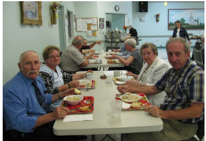
Quelques participants lors de la rencontre du 2 juin

L'assemblée d'affaire fut suivie d'une présentation de Claude Degrâce portant sur la création du parc national Kouchibouguac avec toutes les expropriations, la disparition des villages et les déplacements de population que cet événement a créé. Cette présentation fut bien appréciée.