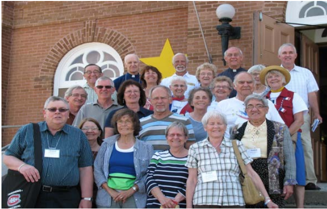
Quelques personnes du Nouveau-Brunswick suite à la messe de clôture du CMA

Bien que le voyage par autobus prévu par l'ARNB en mars dernier n'ait pas pu se réaliser faute d'un manque d'inscription, plusieurs membres de l'Association du Nouveau-Brunswick se sont rendus par eux-mêmes au Québec pour assister à la rencontre.