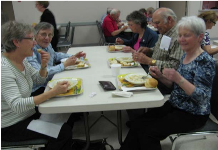
Du fricot au poulet acadien, c'est toujours bon !

La rencontre se termina par un fricot préparé par des membres bénévoles de l'Association.