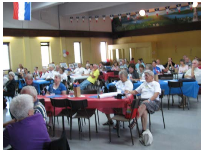
Conférence du samedi matin