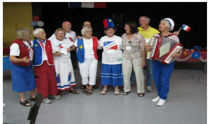
Chants acadiens lors de la soirée du samedi.

Pendant l'après-midi, il y eut des visites au Fort Ingal et à l'Observatoire Aster. Enfin, la journée du samedi se termina par un délicieux souper et une soirée de musique fort animée.