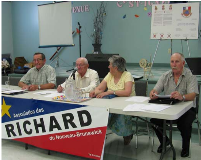
Assemblée générale annuelle du 13 juin à Saint-Ignace