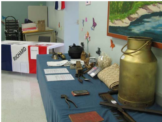
Exposition d'objets anciens lors de l'assemblée générale annuelle de 2010