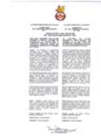
Item 5 CD de photos

Item 1 : Épinglette en plastique avec les armoiries et le mot RICHARD inscrit en haut / Plastic pin with the Coat of Arms and the name RICHARD above.